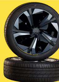
19" felgi ze stopu metali lekkich „Aero”