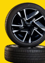
19" felgi ze stopu metali lekkich