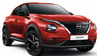
Z10 CZERWONY | Bez dopłaty