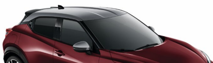
XEE BURGUNDOWY + SREBRNY DACH