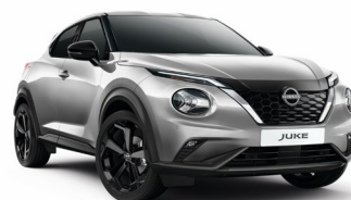
KYO SREBRNY | 3 000 zł