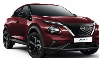
NBQ BURGUNDOWY | 3 000 zł