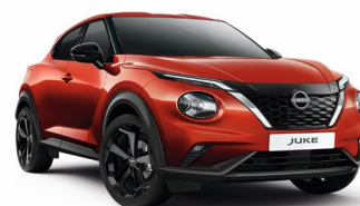
NBV CZERWONY „FUJI SUNSET” | 3 000 zł