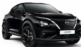
GAT CZARNY PERŁOWY | 3 000 zł