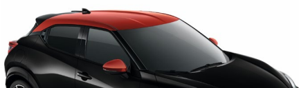
YAX CZARNY PERŁOWY + CZERWONY DACH „FUJI SUNSET”