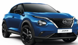
RCF NIEBIESKI | 3 000 zł