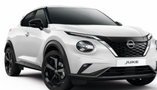
QBE BIAŁY PERŁOWY | 3 000 zł