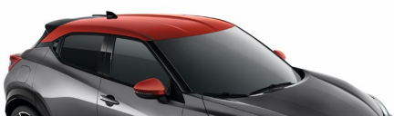
XFB SZARY + CZERWONY DACH „FUJI SUNSET”

*Wersja N-Sport dostępna w lakierach YAV, XKJ, XEX, GAQ, YAS