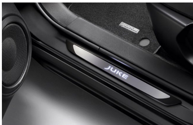
Podświetlane nakładki progów