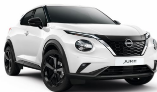
326 BIAŁY | 1 500 zł