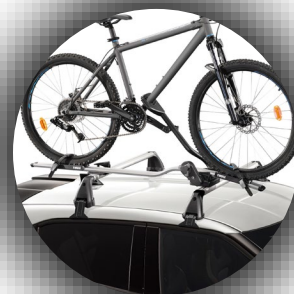
Uchwyt mocowania roweru stalowy