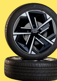
17" felgi ze stopu metali lekkich