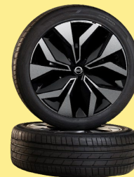
17" felgi „Sakura”