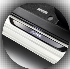
Podświetlane nakładki progów