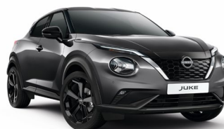
KAD SZARY | 3 000 zł