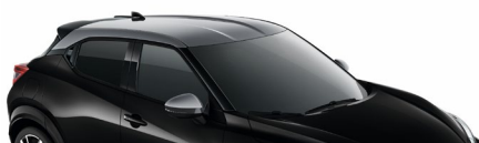
YAY CZARNY PERŁOWY + SREBRNY DACH