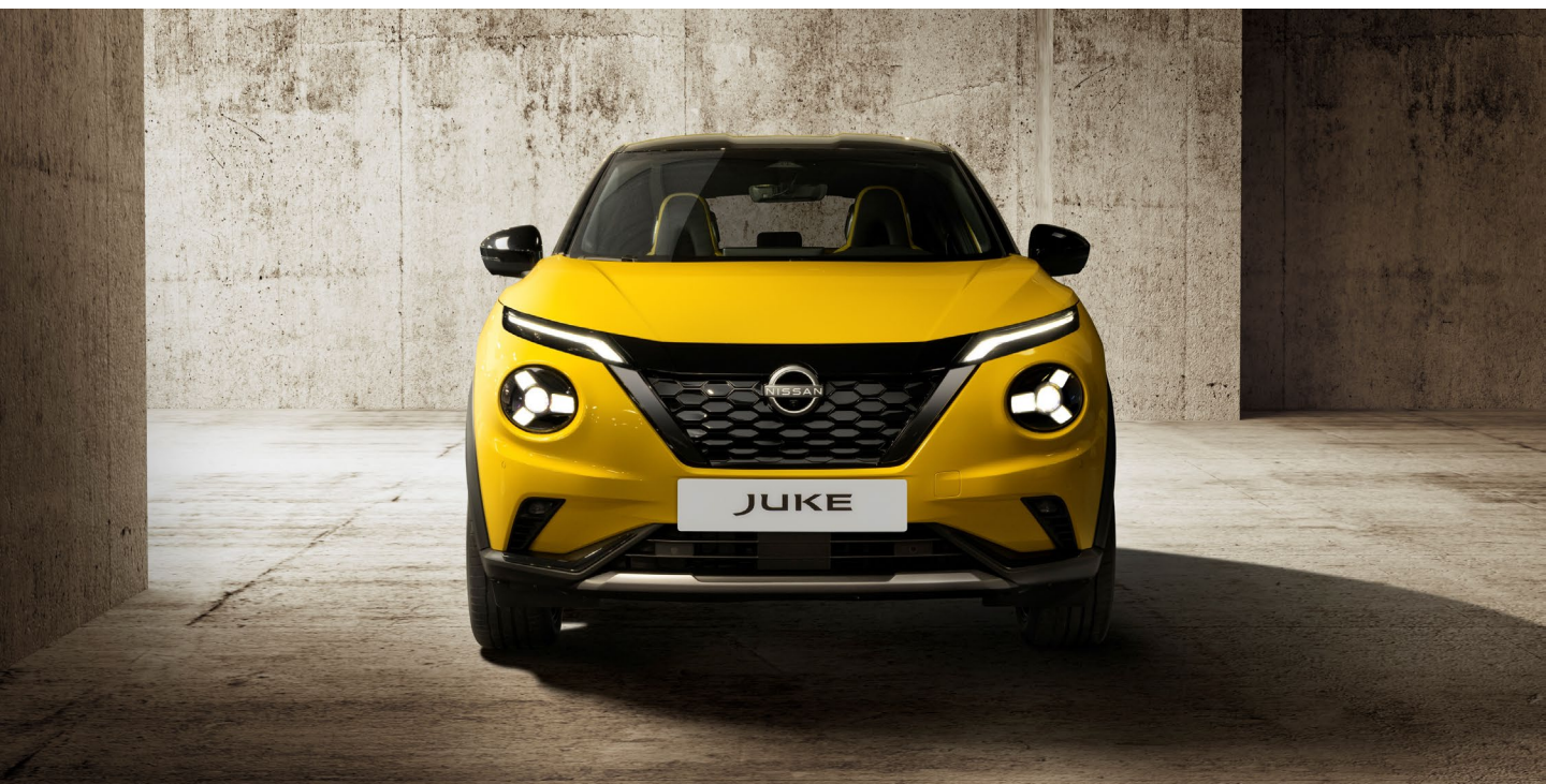
Nowy Nissan Juke