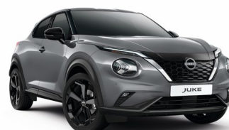
KBY SZARY CERAMICZNY | 3 000 zł