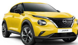
ECE ŻÓŁTY „ICONIC” | 3 000 zł