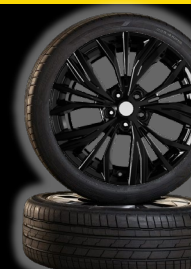
19" felgi ze stopu metali lekkich „Akari”