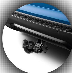
Hak holowniczy zdejmowany