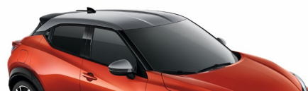
XEZ CZERWONY „FUJI SUNSET” + SREBRNY DACH