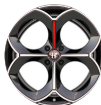
20" Felgi aluminiowe Perfo Kod opcji 5RK