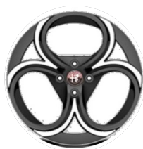
18" Felgi aluminiowe Progressive Kod opcji WP8