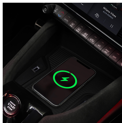
Bezprzewodowa ładowarka smartfona